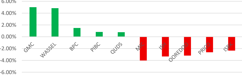
الشركات اكثر انخفاضا وارتفاعا